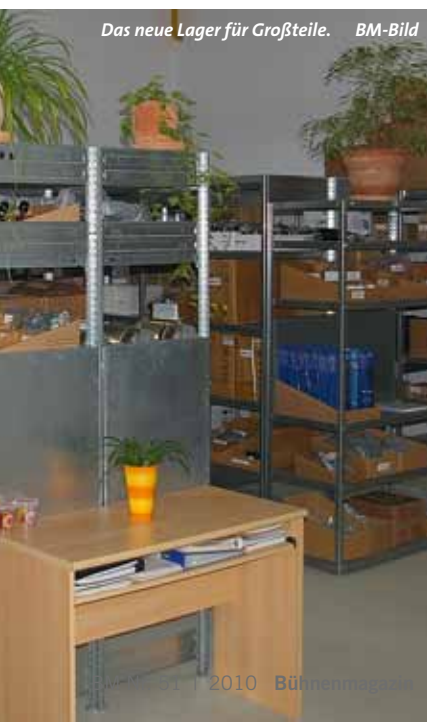
Das neue Lager für Großteile.