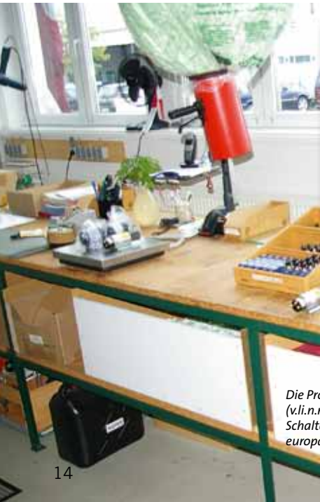
Die Produktneuheiten auf dem Päcktsch (v.li.n.re.): Hubmagnete, Telemecanique-Schalter, deutsches Ladegerät und Joysticks europäischer Hersteller.

Ein Teil einer Wand wurde he- rausgerissen, der Bereich Büro, Nasszelle und Küche des dazu- gewonnenen Bereiches wurden zu einem großen Raum zusam- mengelegt, wo sich nun das neue, doppelt so große Büro befindet. Da der neue Bürokomplex dies- mal zum Parkplatz und Anlie-