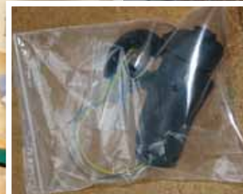
... auch einzelne Kompo- nenten oder wie hier die komplette obere Griff- mechanik nach geordnet werden kann.