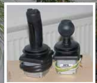
... die neu ins Programm aufgenom- menen Joysticks, für die ...